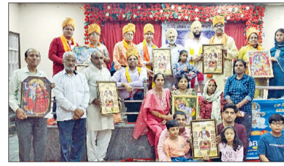
रेवाड़ी। कार्यक्रम में अतिथियों का सम्मान करते आयोजक।