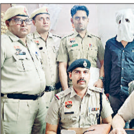
रेवाड़ी। पुलिस गिरफ्तार में हत्या के आरोपी।

गत 31 अक्टूबर की रात पिथड़वास में एक लगव समारोह के दौरान गोली मारकर की गई युवक की हत्या के मामले में पुलिस ने मुख्य आरोपी सहित दो लोगों को गिरफ्तार कर लिया। उन्हें कोर्ट में पेश करने के बाद रिमांड पर लिया गया है। रिमांड के दौरान उनसे हथियार व वाहन की बरामदगी की जाएगी। बधराना