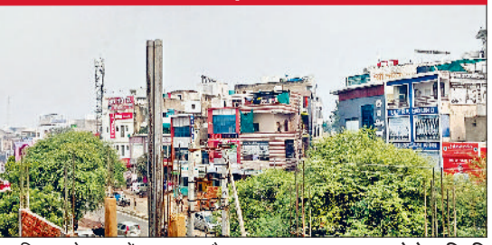
रेवाड़ी। रविवार को शहर में साफ रहा मौसम।