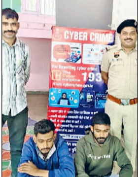
रेवाड़ी। पुलिस गिरफ्तार में ठगी के आरोपी।