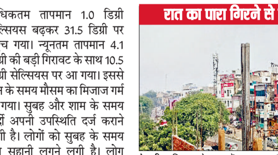
रेवाड़ी। रविवार को शहर में साफ रहा मौसम।

बीते सप्ताह लगातार आसमान में बादल छाए रहने के बाद आसमान साफ हो गया है। बादल छूटने के बाद तेज धूप निकलने ही दिन का पारा चढ़ना शुरू हो गया है। रात का तापमान गिरने से सर्दी का असर बढ़ना शुरू हो गया है। इस सप्ताह मंगलवार को आसमान में आंशिक बादल छा सकते हैं, लेकिन बारिश की कोई संभावना नहीं है। रविवार को सुबह से ही आसमान साफ रहा। प्रदूषण के कारण धुएँ की चादर आसमान में जरूर बनी रही। सुबह से शाम तक तेज धूप खिली रही।