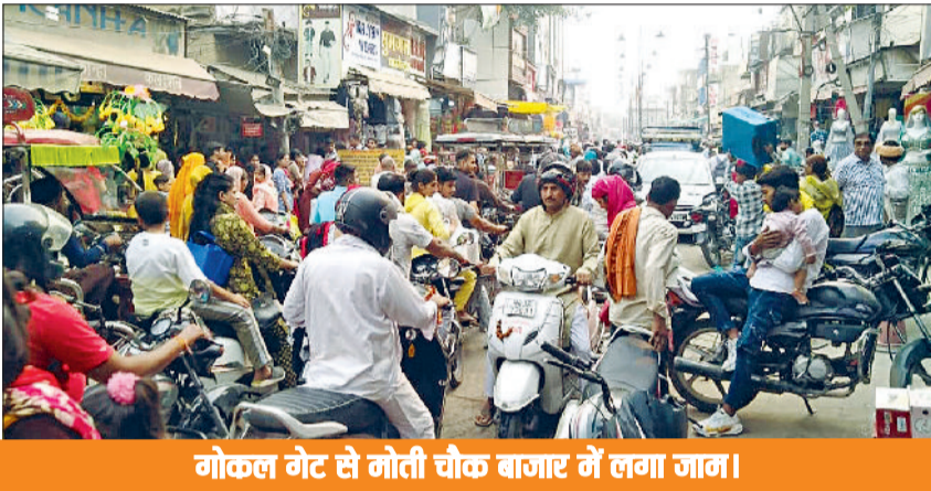
गोकल गेट से मोती चौक बाजार में लगा जाम।