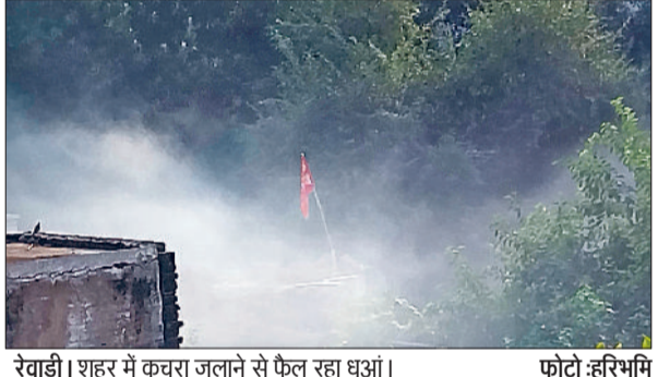
रेवाड़ी। शहर में कचरा जलाने से फैल रहा धुआं।

आसमान से बादल साफ होने और तेज हवाएं चलने के बावजूद धारूहेड़ा में प्रदूषण का खतरा बढ़ता जा रहा है। एक्यूआई बढ़कर 434 तक पहुंच गया है, जो साथ लगे गुरुग्राम महानगर से भी काफी ज्यादा है। प्रदूषण कंट्रोल बोर्ड के प्रयास कागजी साबित हो रहे हैं। लोगों का साफ हवा में सांस लेना मुश्किल बना हुआ है। ग्रेप-3 स्टेशन की पार्बंदियां भी जल्द लागू हो सकती हैं। दिवाली पर्व के बाद से ही धारूहेड़ा का एक्यूआई बढ़ा हुआ है। इसमें उतार-चढ़ाव तो आ रहा है, परंतु यह 300 से कम नहीं आ पा रहा है। बीते सप्ताह आसमान में बादल छाने के कारण उम्मीद जताई जा रही थी कि आसमान साफ होते ही प्रदूषण का स्तर भी कम हो जाएगा।