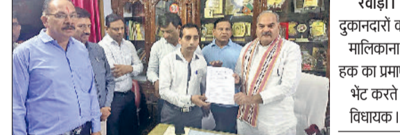
रेवाड़ी। दुकानदारों को मालिकाना हक का प्रमाण भेंट करते विधायक।