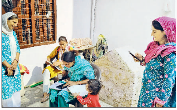
रेवाड़ी। अभियान के तहत सर्वे करते हुए स्वास्थ्यकर्मी। वटीबी मुक्त अभियान के लिए स्वास्थ्य विभाग की टीम।

टीबी मुक्त भारत अभियान के तहत स्वास्थ्य विभाग ने अब शहर के वार्डों में सर्वे अभियान शुरू कर दिया है। इससे पहले स्वास्थ्य विभाग की ओर से ग्रामीण क्षेत्रों को टीबी मुक्त बनाने की पहल की गई थी, उसी तर्ज पर अब शहरी वार्डों को भी टीबी मुक्त वार्ड घोषित किया जाएगा। अभियान के तहत शहर के 31 वार्डों में घर-घर